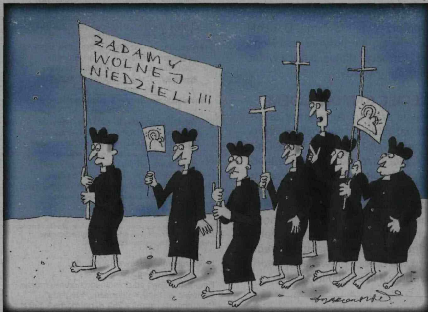
III NAGRODA – Dariusz Dąbrowski za pracę bez tytułu.